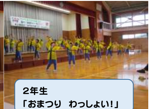
2年生 「おまつり わっしょい!」