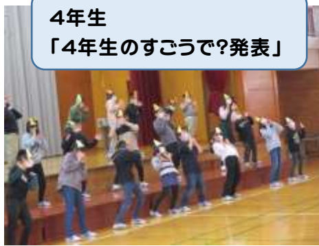
4年生 「4年生のすごいで？発表」