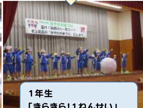
1年生 「きらきら!1ねんせい」