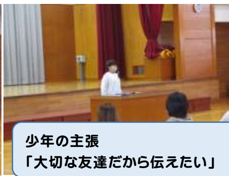
少年の主張 「大切な友達だから伝えたい」