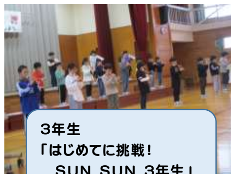
3年生 「はじめてに挑戦！ SUN SUN 3年生」