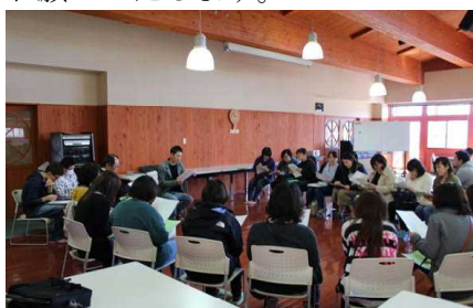
専門委員会の顔合わせ

授業参観後にはPTA総会もありました。事業報告・決算報告が承認され、2019年度の事業計画・予算案が承認されました。続いて役員改選が行われました。今年度からは全ての会員が専門員や学年委員としてご活躍いただきます。初年度ですので、何かと戸惑うこともあるかもしれませんが、みんなでやっていくことが大切だと思います。よろしくお願いいたします。