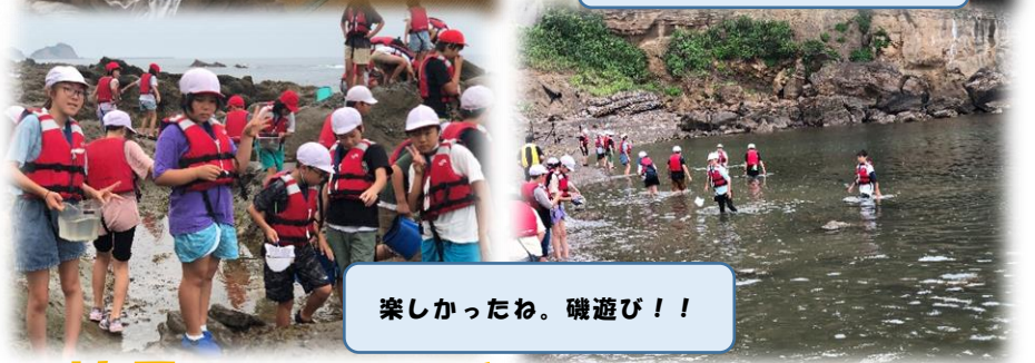
楽しかったね。磯遊び！！