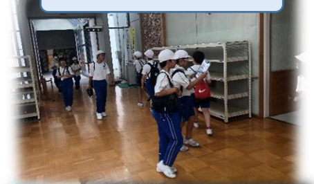
フォトオリエンテーリング