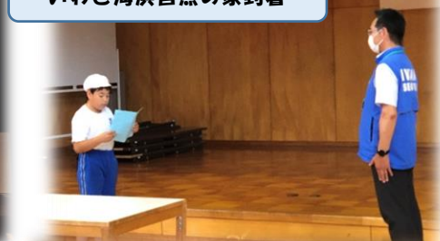
いわき海浜自然の家到着