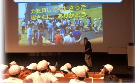
アクアマリンで震災学習