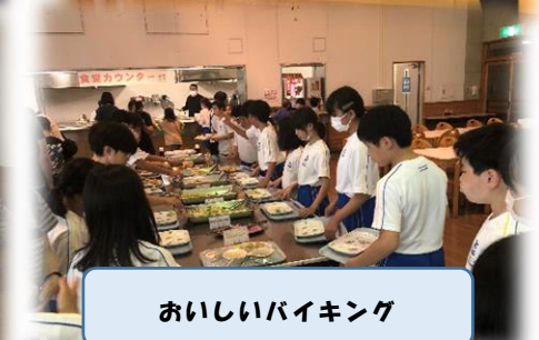
おいしいバイキング