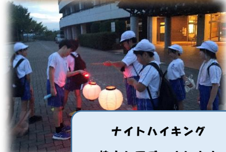
ナイトハイキング 協力してゴールします