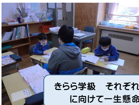
きらら学級 それぞれのめあて達成に向けて一生懸命です！！