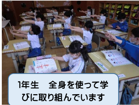
1年生 全身を使って学びに取り組んでいます