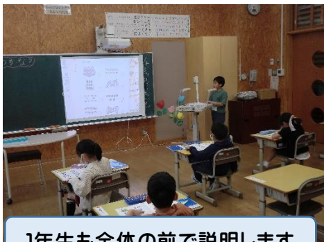
1年生も全体の前で説明します

新年度がスタートした4月。入学、進級した子どもたちは「 ドリーム 」めざして、学習に一生懸命に取り組んできました。その学びの様子的一端を掲載いたします。