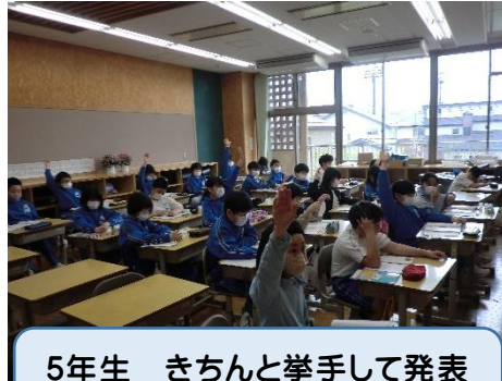
5年生 きちんと挙手して発表を頑張っています