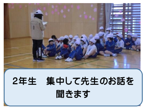
2年生 集中して先生のお話を聞きます