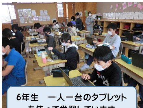
6年生 一人一台のタブレット を使って学習しています

本校ホームページには児童の学びの様子などを日々掲載しております。教育活動の様子的一端を紹介しておりますので、こちらをご覧くださいければありがたいです。