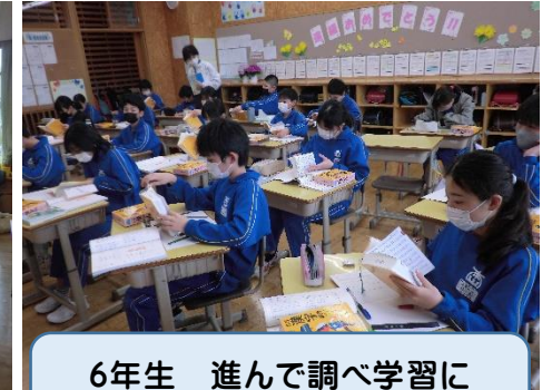
6年生 進んで調べ学習に取り組んでいます