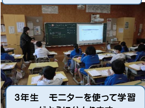
3年生 モニターを使って学習がさらに分かります