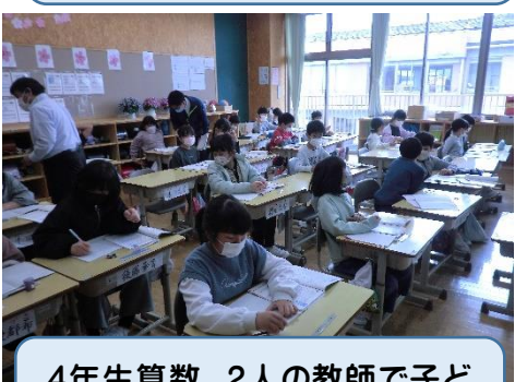
4年生算数。2人の教師で子どもたちの力を高めています