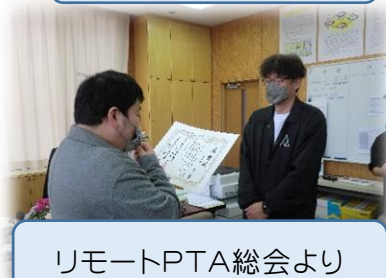
リモートPTA総会より