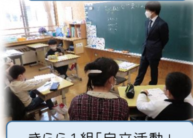
きらら1組「自立活動」