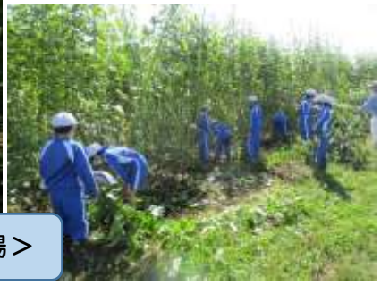
<ケナフ刈り取り4年生:9月29日町体験農場>