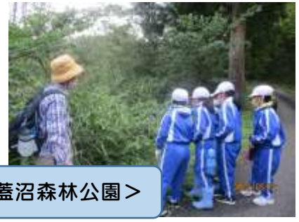
<森林学習3年生:9月27日蓋沼森林公園>