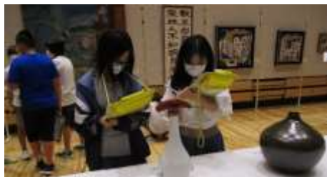
町総合美術展鑑賞(5,6年)本物に触れる学習です。

2学期がスタートして2週間が過ぎました。各学級とも集中してじっくりと学習に取り組んでいます。2学期は、学習面、運動面が大きく伸びる学期です。集中して授業に取り組むことはもちろん、家庭学習にもしっかりと取り組み、自分の可能性を大きく伸ばしてほしいと思います。ご家庭でのお声掛けをよろしくお願いいたします。