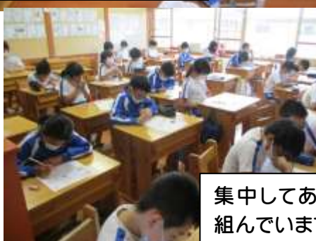
集中してあきらめずに何度も問題に取り組んでいます。(4年,さくら2組)