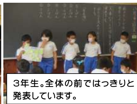
3年生。全体の前ではっきりと発表しています。