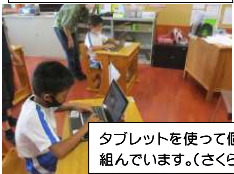
タブレットを使って個に応じた学びに取り組んでいます。(さくら1組、ひまわり)