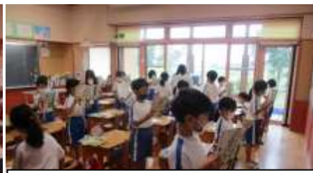
1年生の音読。良い姿勢で何回も読みます。