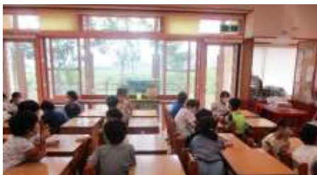
2年生。ペアで話し合い、考えを深めています。