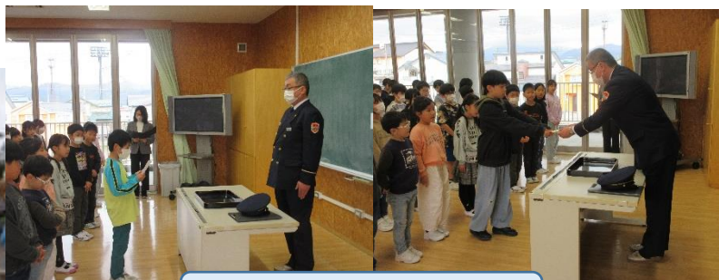
4. 5年生消防クラブ結団式