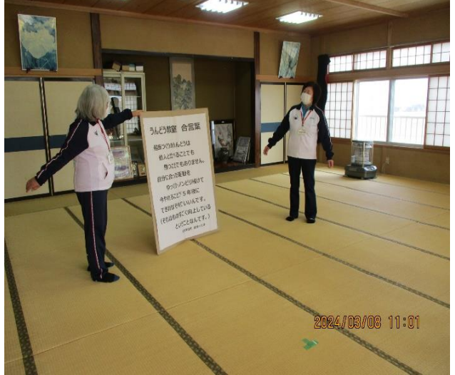
最後に「うんどう教室合言葉」を唱和する様子