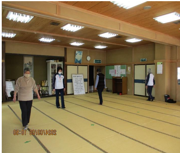
畳縁で踏かない運動の様子