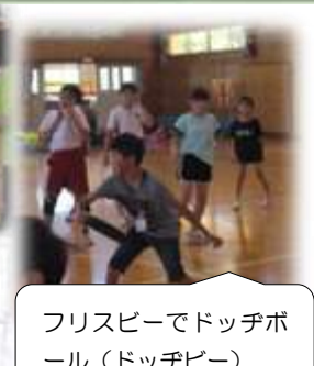
フリスビーでドッジボール(ドッジビー)