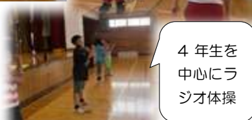
4年生を中心にラジオ体操

1学期最後の風の子スクールは「自由あそび」でした。バドミントン・バスケットボール・ドッジボール・工作などそれぞれ好きなことを楽しみました。